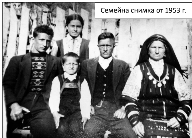
Семейна снимка от 1953 г.